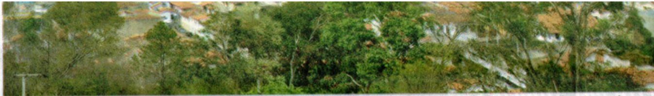
Vista panorâmica de Porto Feliz: município se prepara para receber investimentos nos próximos meses. Prefeitura aposta na melhoria do sistema de ensino para formar m

Míriam Bonora Colaboração para o BOM DIA