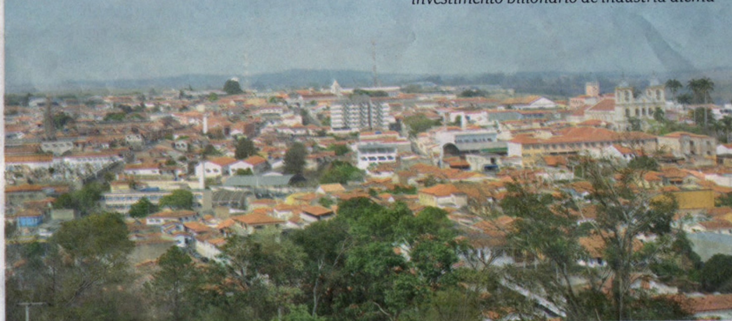
Vista panorâmica de Porto Feliz: município se prepara para receber investimentos nos próximos meses. Prefeitura aposta na melhoria do sistema de ensino para formar mão de obra

Município se estrutura para receber novas empresas, Copa do Mundo e Olimpíadas. Primeiro passo está por vir, com um investimento bilionário de indústria alemã